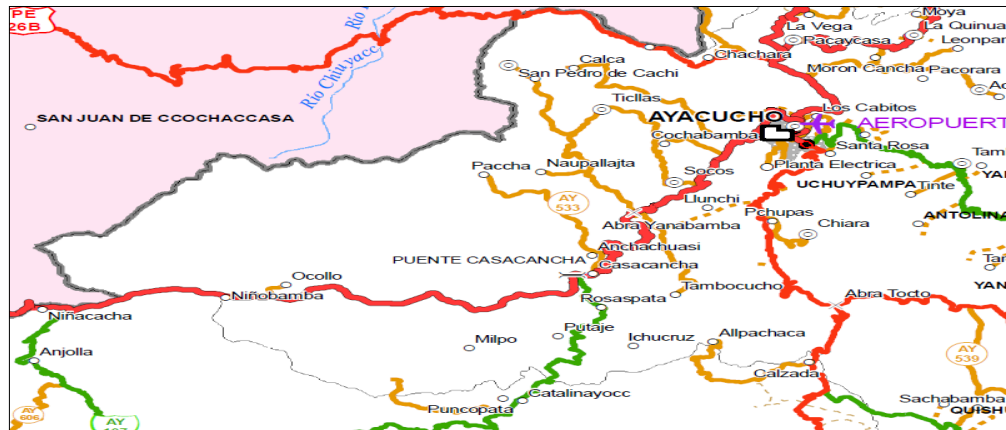
Red vial de integración con el Centro Poblado de Paccha

Dictamen recaído en el Proyecto de Ley 6068/2020-CR, que propone declarar de interés nacional y necesidad pública la creación del distrito de Santuario de Paccha, provincia de Huamanga, departamento de Ayacucho.